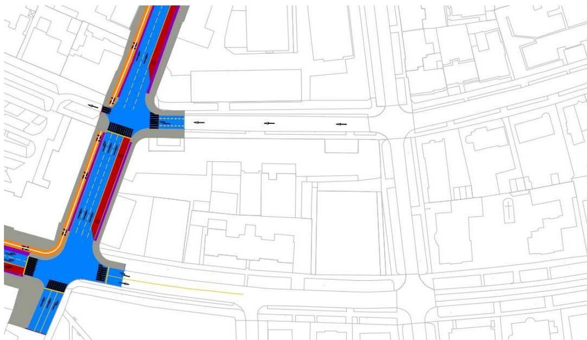
Figura 1. Plan General propus Inelul 1. Studiul de Fezabilitate, 2014

Este remarcat faptul că, cu excepția corecției frontului stradal de pe str. 20 Decembrie 1989, unde se necesită achiziționarea a cca. 400 mp (teren proprietate privată), pe restul traseului, terenul (prospectele stradale) face parte din domeniul public al Primăriei Timișoara.